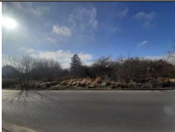
Widok na teren 3MN przy ul. Kombatantów

Istniejące w obszarze opracowania biotopy, które posiadają cechy antropogenicznego zdegradowania są mało atrakcyjne dla wielu przedstawicieli fauny. Najlicniejszą gromadą kręgowców występującą w tym terenie są ptaki. Peryferyjne położenie, zadrzewienia, zarośla i zakrzewienia stwarzają dogodny system do ich migracji. Mogą one w czasie wędrówek znajdować w obszarze planu schronienie, bazę pokarmową i miejsce odpoczynku. Zarośla o zwartej strukturze stanowią potencjalne miejsce rozrodu dla wielu wróblowatych i innych średniej wielkości ptaków. Najliczniej występują tutaj: sikory, wróble, kosy, szpaki, jaskółki, nielicznie sroki. W obszarze opracowania stwierdzono liczne ślady bytowania dzika.