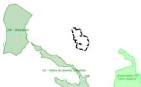
Rys. 3. Usytuowanie obszaru planu „Bukowo - Kombatantów” na tle istniejących i proponowanych form ochrony przyrody