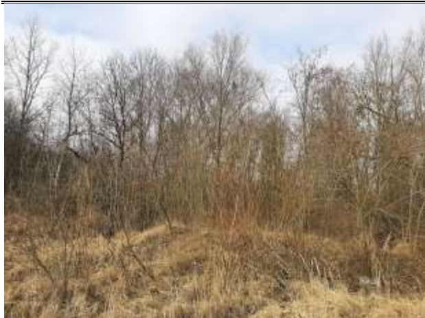
Widok na teren 2MW i wydzielanie 2.1ZP przy ul. Kolonistów Źródło: Materiały autorskie marzec 2022