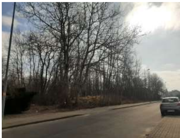
Widok na zagłębienie terenowe 1ZP od ul. Kombatantów Źródło: Materiały autorskie marzec 2022

Tereny niezagospodarowane położone po południowej stronie ul. Kolonistów to dawne uprawy sadownicze, które na przestrzeni wielu lat ulegały sukcesji wtórnej. Aktualnie charakteryzują się występowaniem starych drzew owocowych oraz topoli osiki, wierzby iwy, brzozy brodawkowatej i miejscami jesionów, klonów, głogów, dzikiej róży, podrostu leszczyny, występują również pojedyncze egzemplarze dębów. Wiele gatunków drzew tutaj występujących charakteryzuje się małym obwodem pni i pokrojem krzewiastym. Jest to spowodowane wieloletnim brakiem pielęgnacji i zabiegów sanitarnych, a także brakiem cięć prześwietlających. Niewielkie połacie tworzą również traworośla oraz zarośla jeżynowe. Teren przy ul. Kolonistów jest wykorzystywany do nielegalnego zrzutu odpadów budowlanych i bytowych.