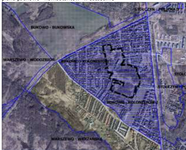
Rys. 1. Obowiązujące miejscowe plany zagospodarowania przestrzennego w obrębie i otoczeniu obszaru objętego granicami planu „Bukowo - Kombatantów” w Szczecinie