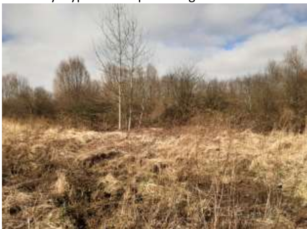
Widok na teren elementarny 1MW od ul. Kolonistów

Mimo obecności terenów otwartych i niezagospodarowanych analizowany teren odznacza się niewielką bioróżnorodnością roślinności. Zasoby florystyczne terenów otwartych omawianej przestrzeni stanowią przede wszystkim traworośla, zbiorowiska zaroślowe i zieleń wysoka. W zagłębieniu terenowym w centralnej części planu (teren elementarny 1ZP) występują głównie topole osiki, głogi, brzozy brodawkowate i bez czarny. Zbiorowisko to posiada skład gatunkowy zbliżony do łągu wiązowo-jesionowego. Przedpole tego terenu stanowi otwarta przestrzeń zdominowana przez traworośla oraz zarośla jeżynowe, wierzbowe i osikowe (teren elementarny 1MW). W trakcie opracowywania niniejszego dokumentu trwały prace rewaloryzacyjne fragmentu terenu 1ZP (bezpośrednio przyległego do ul. Kolonistów), na którym pozostawiono dojrzałe i zdrowe drzewa, wśród których umieszczono elementy wyposażenia parkowego.